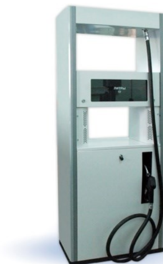
Рисунок 6 – ТРК «КВАНТ», тип корпуса 6

Схемы пломбировки основных элементов колонок приведены на рисунках 7 – 10.