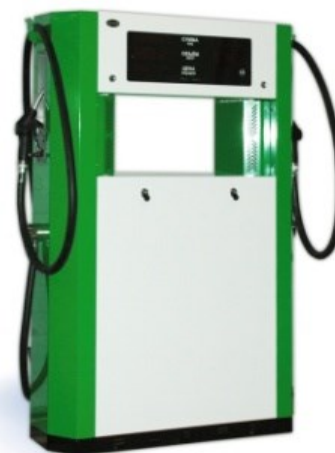
Рисунок 4 – ТРК «КВАНТ», тип корпуса 4