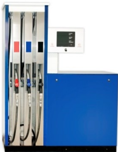
Рисунок 5 – ТРК «КВАНТ», тип корпуса 5