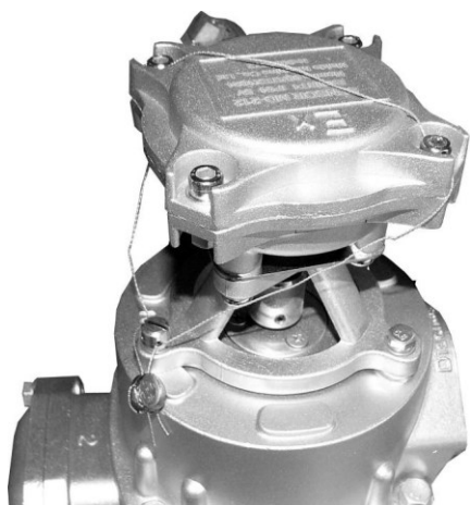
Рисунок 9 – Пломбирование генератора импульсов