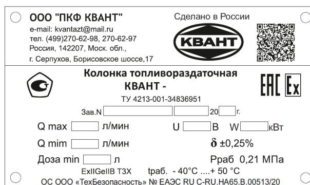
Рисунок 11 – Маркировочная табличка с заводским номером и знаком утверждения типа

Знак утверждения типа и заводской номер, состоящий из XXX цифр, наносятся на маркировочную табличку, закрепляемую на корпусе колонки.