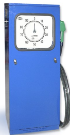
Рисунок 2 – ТРК «КВАНТ» с механическим стрелочным отсчётным устройством, тип корпуса 1