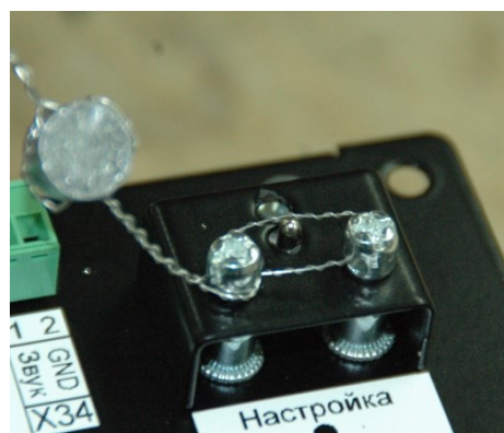
Рисунок 10 – Пломбирование фиксирующей планки блока индикации и управления «КВАНТ»

Знак утверждения типа и заводской номер, состоящий из XXX цифр, наносятся на маркировочную табличку, закрепляемую на корпусе колонки.