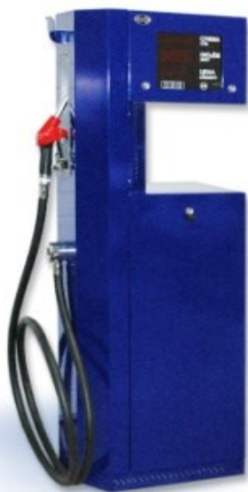
Рисунок 3 – ТРК «КВАНТ», тип корпуса 2

Для исключения возможности непреднамеренных и преднамеренных изменений измерительной информации, всё оборудование, входящие в состав колонок, пломбируются в соответствии с эксплуатационной документацией на него, все линии связи пломбируются в местах, где возможно несанкционированное воздействие на результаты измерений.