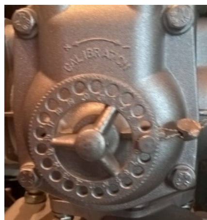
Рисунок 8 – Пломбирование счётчика жидкости объёмного типа