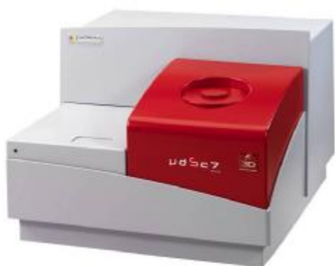
MICRO DSC7 EVO