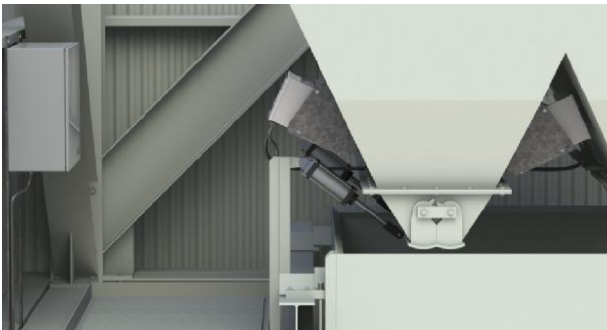
Рис. 2 - Внешний вид анализатора ТВМ в бункерном исполнении

Модификация ТВМ 210 является базовой и предназначена для установки на конвейерной (поточной) линии, по которой происходит транспортировка сыпучего материала. Модификация ТВМ 230 предназначена для использования на конвейере с большей толщиной слоя сыпучего материала, или для измерения влажности материалов с большей степенью поглощения микроволнового сигнала. Источник микроволнового сигнала ТВМ 230 генерирует более низкочастотное микроволновое излучение, имеющее большую проникающую способность.