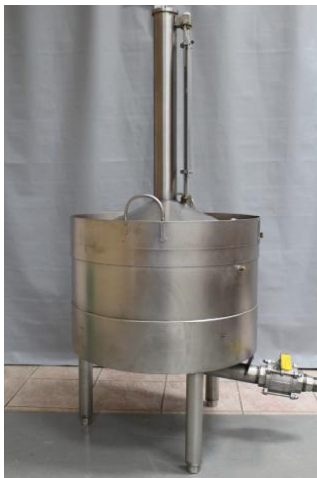
Рисунок 1 – Общий вид мерника металлического эталонного 1-го разряда SERIES «М»

Общий вид мерника металлического эталонного 1-го разряда SERIES «М» приведен на рисунке 1.