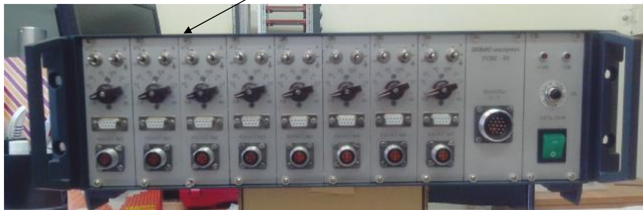
Рисунок 2 – Внешний вид УСВС