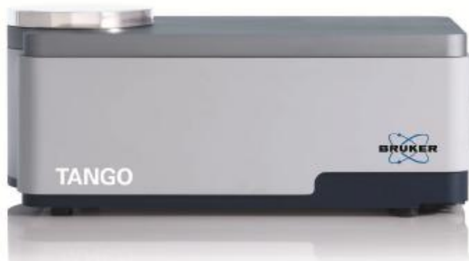
Рисунок 1 - Общий вид Фурье - спектрометров инфракрасных TANGO-T без сенсорного экрана