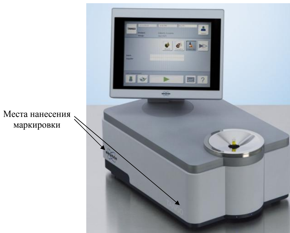
Рисунок 2 - Общий вид Фурье - спектрометров инфракрасных TANGO-T с сенсорным экраном с обозначением мест нанесения маркировки