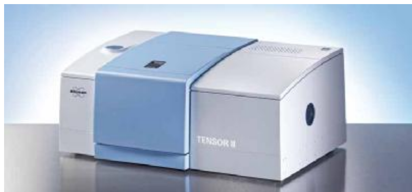
Рисунок 1 - Общий вид Фурье-спектрометров TENSOR II

Фурье-спектрометры представляют собой стационарные автоматизированные приборы.