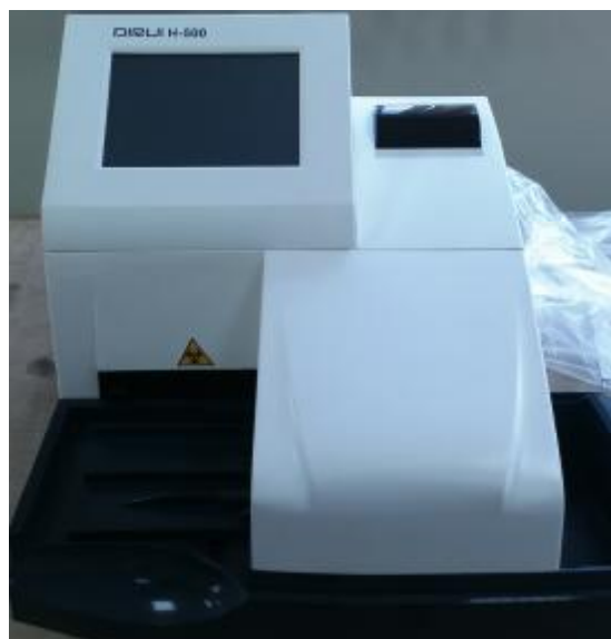
Рисунок 1 – Анализатор мочи Н-500

Анализаторы оснащены последовательным портом (разъем RS-232) для передачи информации на ПК и параллельным портом для принтера.