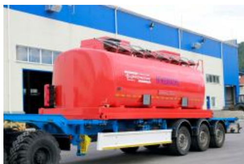
Рисунок 2 – КЦ с двумя секциями