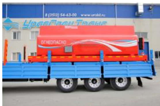
Рисунок 4 – КЦ с вариантами исполнения от четырех до десяти секций