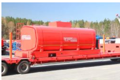
Рисунок 1 – КЦ с одной секцией

Внешний вид КЦ представлен на рисунке 1, 2, 3, 4. Место пломбирования обозначено на рисунке 5, 6 и 7.