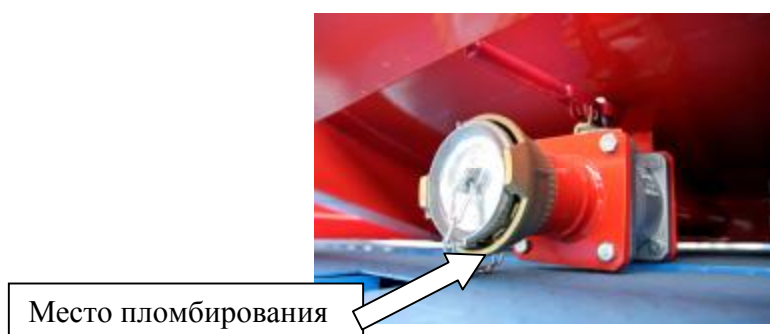
Рисунок 7 – Заглушка открывания трубопровода слива топлива из КЦ