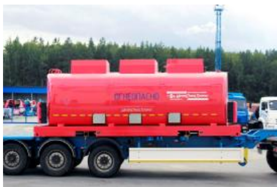
Рисунок 3 – КЦ с тремя секциями