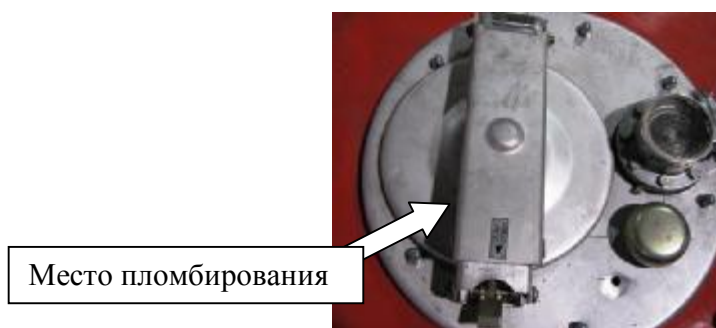
Рисунок 5 - Запорный механизм крышки заливной горловины КЦ