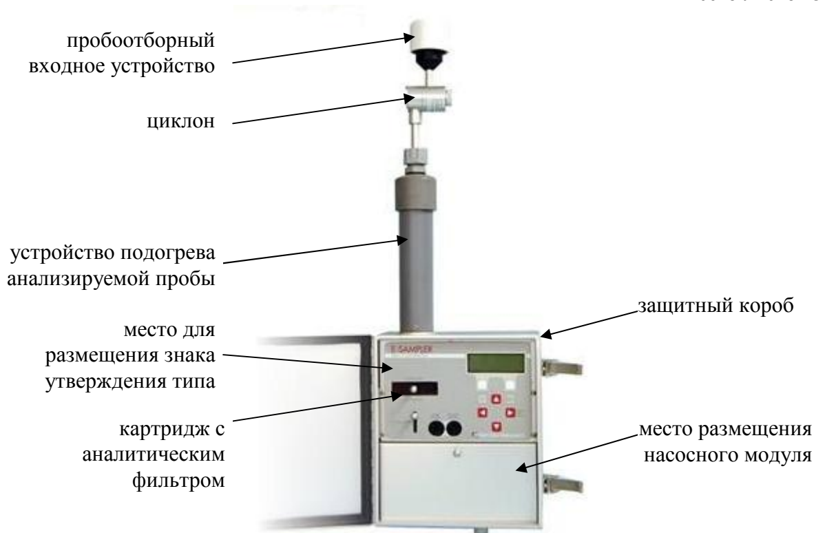
Рисунок 1 – Внешний вид анализатора пыли E-Sampler и обозначение места для размещения знака утверждения типа