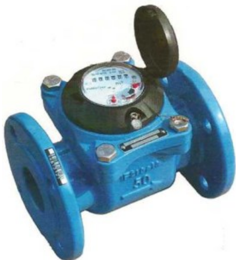
а) Счетчик воды турбинный ВСХН-50