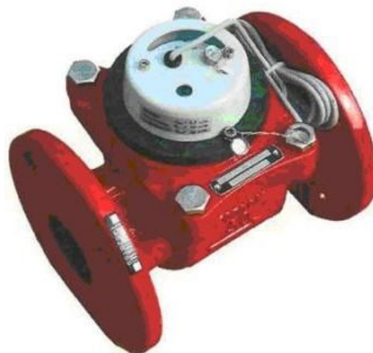
г) Счетчик воды турбинный ВСТН-50