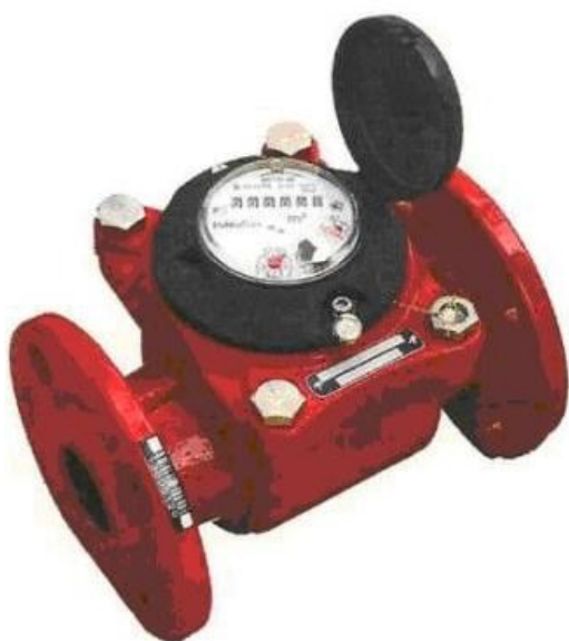
в) Счетчик воды турбинный ВСГН-50