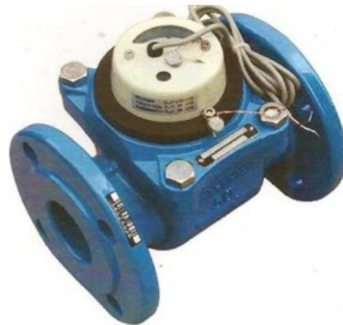
б) Счетчик воды турбинный ВСХНд-50