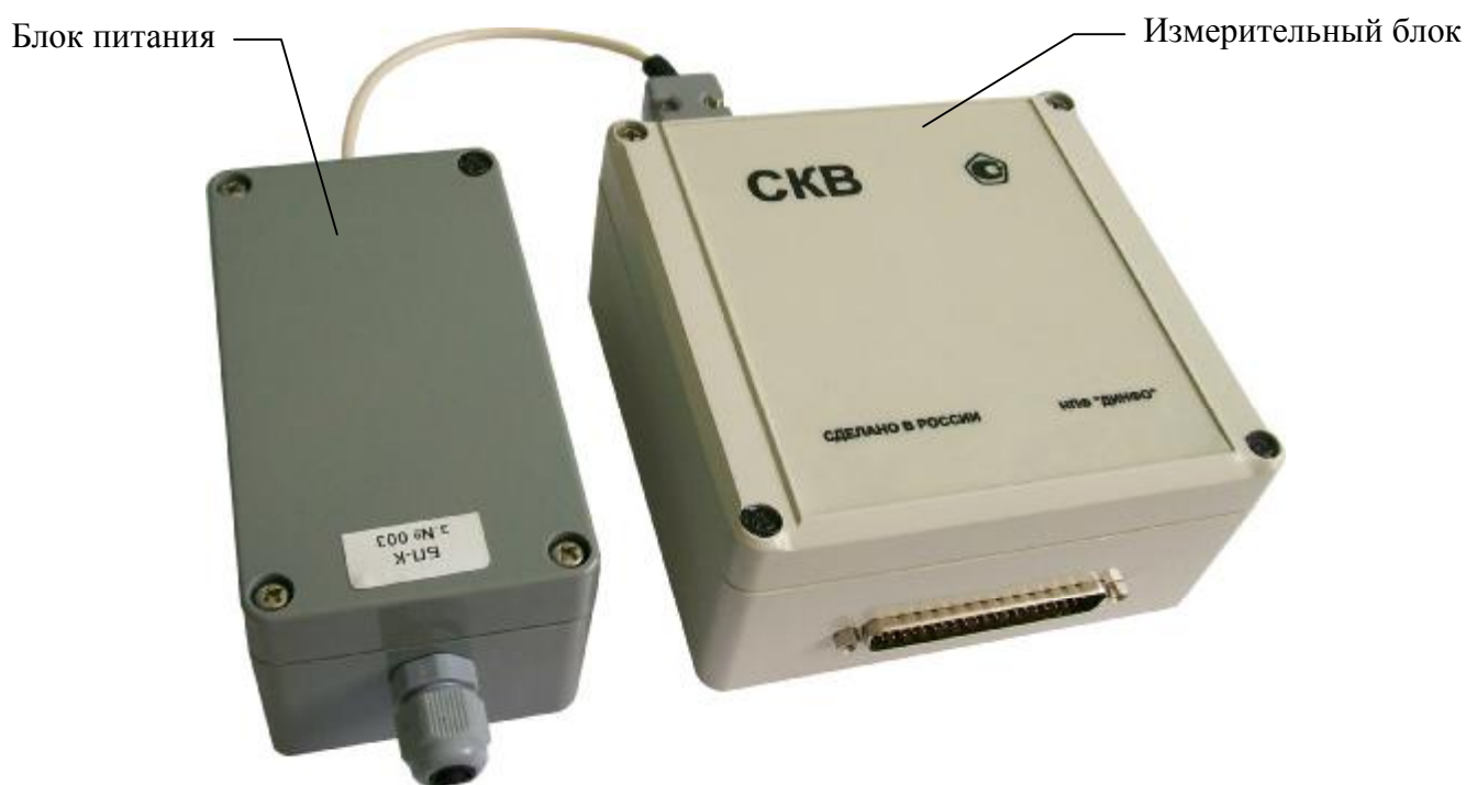
Рисунок 1 – Общий вид калибраторов СКВ

В зависимости от пределов допускаемых относительных погрешностей мер существуют три класса калибраторов СКВ, метрологические характеристики которых приведены в таблице 1.