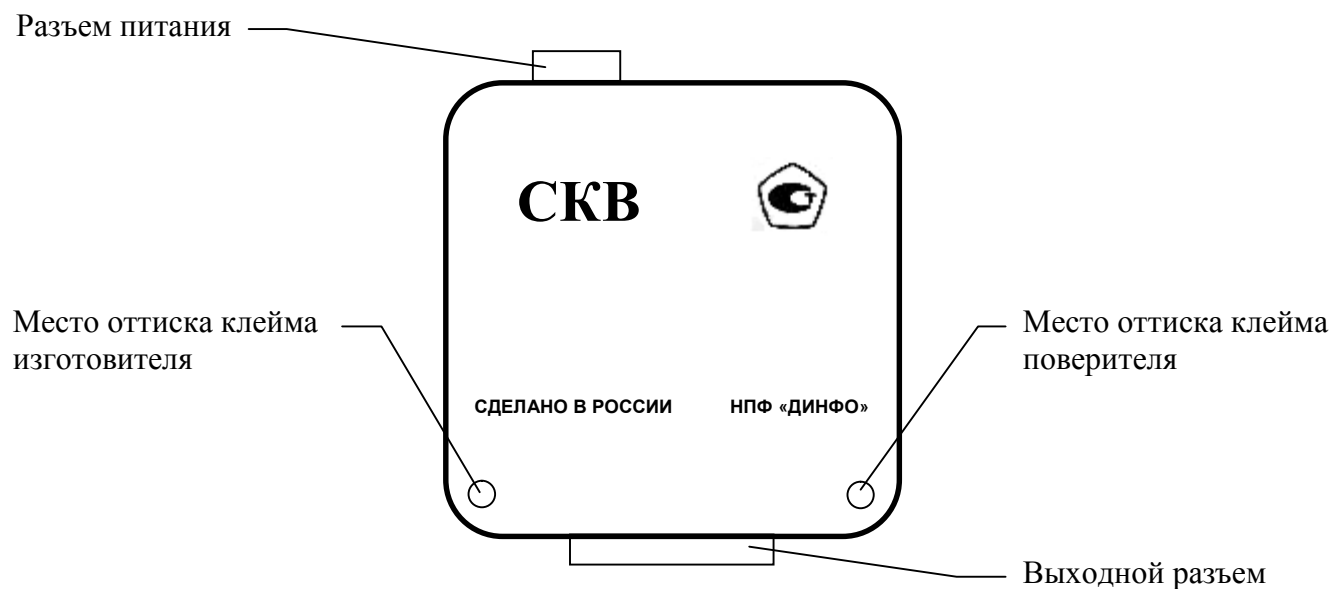
Рисунок 2 – Схема нанесения оттисков клейма на измерительный блок

Схемы нанесения оттисков клейма на измерительный блок и блок питания калибраторов СКВ приведены на рисунках 2, 3 соответственно.