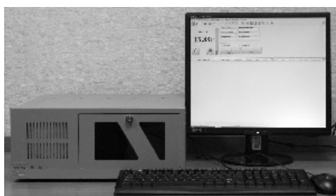
Рисунок 2 – Общий вид индикатора