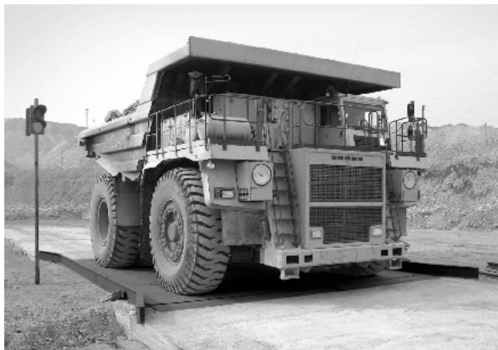
Рисунок 1 – Общий вид ГПУ весов

Примеры общего вида ГПУ весов и индикатора представлены на рисунках 1 и 2 соответственно.