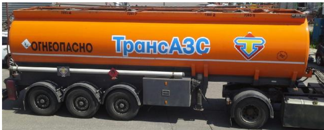
Рис. 1 - Общий вид полуприцепа-цистерны ALI RIZA USTA A3TY

Общий вид полуприцепа-цистерны ALI RIZA USTA A3TY представлен на рисунке 1.