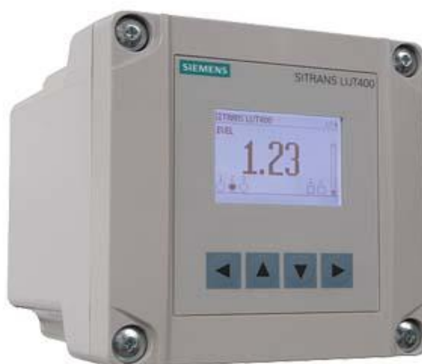
Рисунок 1 — Электронный блок уровнемера

Уровнемеры состоят из электронного блока и ультразвуковых преобразователей. Преобразователи и электронный блок соединены между собой линиями проводной связи. Общий вид электронного блока уровнемера приведен на рисунке 1. Общий вид ультразвуковых преобразователей приведен на рисунке 2.