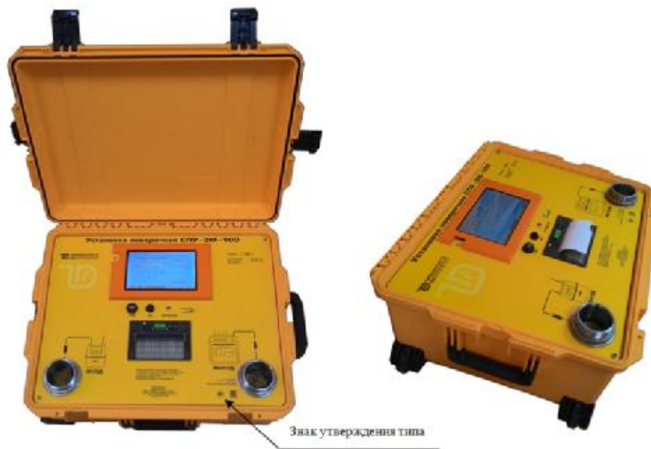
Рисунок 1- Общий вид установок поверочных СПУ-3М-100

Пломбирование установок поверочных СПУ-3М-100 и обозначение мест для нанесения поверительных клейм в целях предотвращения несанкционированной настройки и вмешательства осуществляется в соответствии со схемой на рисунке 2.