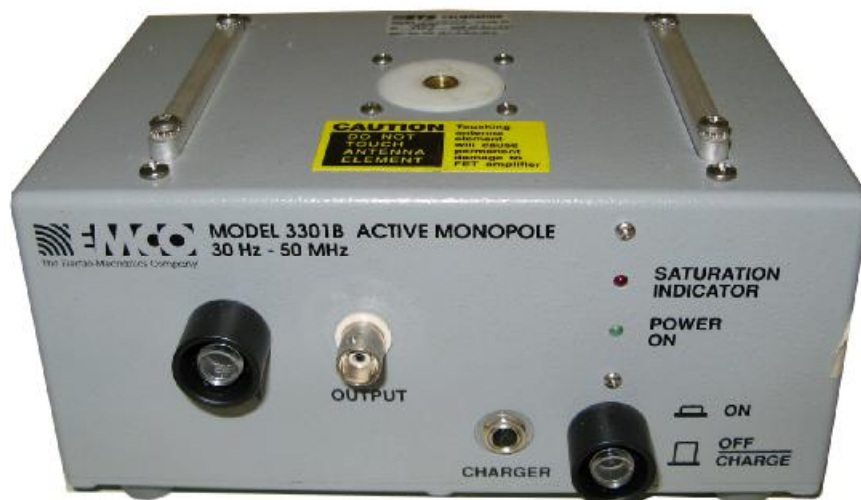
Рисунок 3 - Внешний вид основного блока