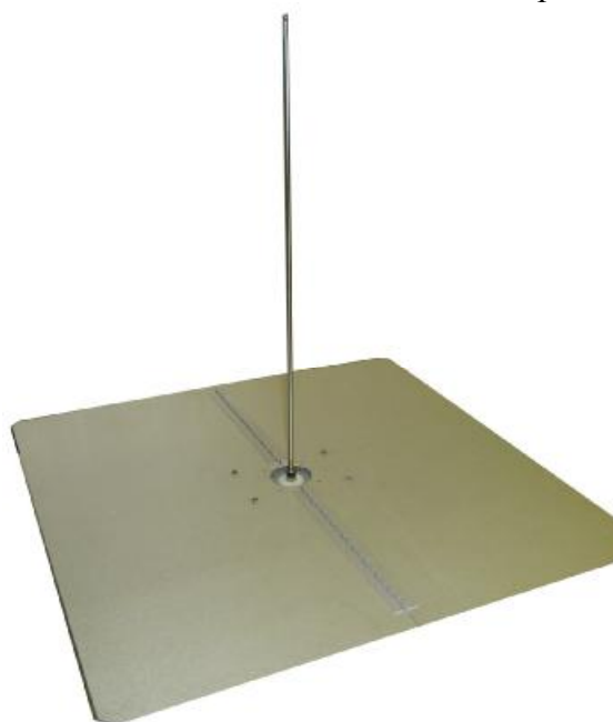
Рисунок 1 - Внешний вид телескопического приемного штыря с квадратным противовесом

Внешний вид основного блока приведен на рисунке 3.