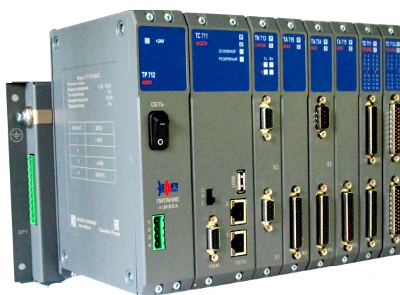
Рисунок 1 – Общий вид контроллера

Общий вид коммутационной панели с указанием места нанесения заводского номера, представлен на рисунке 2.