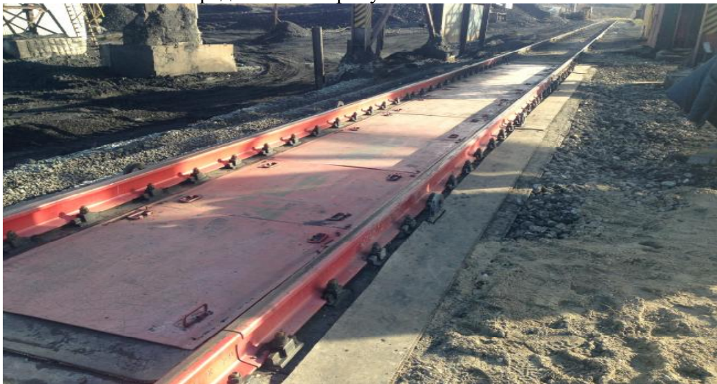
Рисунок 1 - Общий вид весов СИБИРЬ-С150/2-С16А/WE-F

Общий вид весов вагонных неавтоматического действия модификации СИБИРЬ-С150/2-С16А/WE-F представлен на рисунке 1.