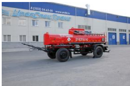
Рисунок 1 – ПЦ с одной секцией

Внешний вид ПЦ и ППЦ представлен на рисунке 1, 2, 3, 4. Место пломбирования обозначено на рисунке 5, 6 и 7.