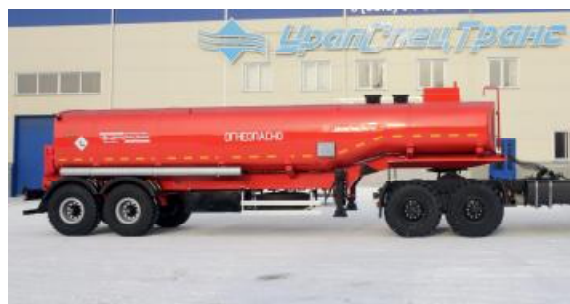
Рисунок 2 – ППЦ с одной секцией