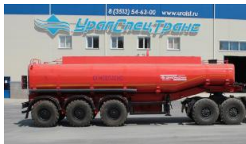
Рисунок 4 – ППЦ с вариантами исполнения от одной до десяти секций