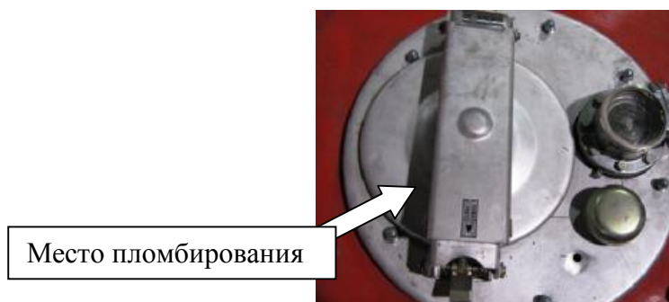
Рисунок 5 - Запорный механизм крышки заливной горловины ПЦ и ППЦ