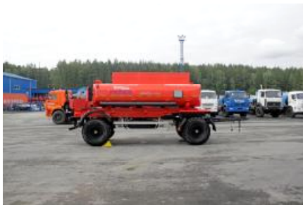
Рисунок 3 – ПЦ с вариантами исполнения от одной до десяти секций