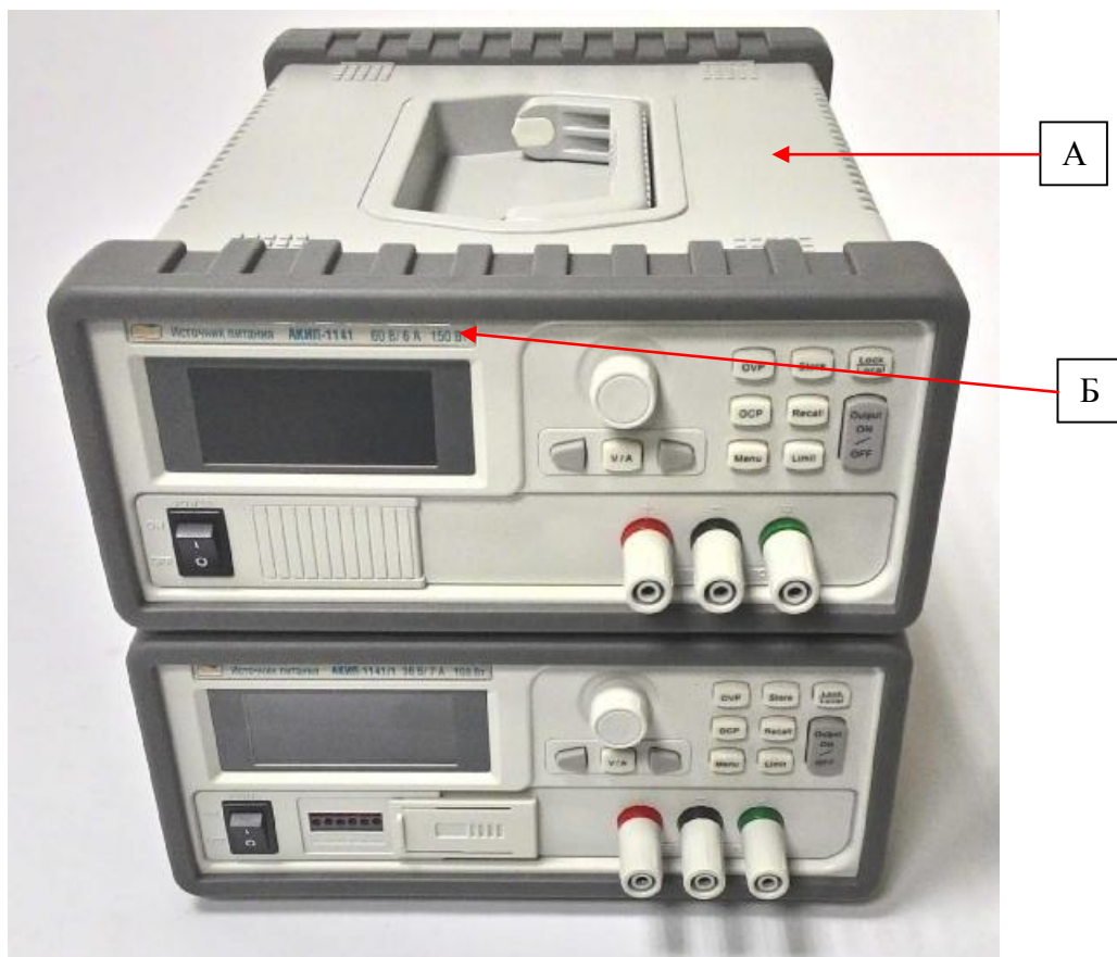
Рисунок 1 – Общий вид источников, место для нанесения знака поверки (А) и знака утверждения типа (Б)