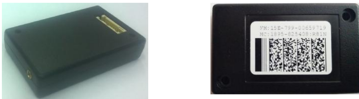
Рисунок 1 – Общий вид блока

Внешний вид блока приведен на рисунках 1-2.