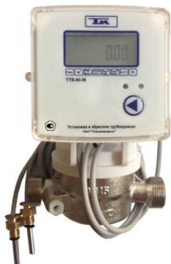
Рисунок 1 – Внешний вид теплосчетчика ТТК-01-М

Внешний вид теплосчетчика ТТК-01-М представлен на рисунке 1.