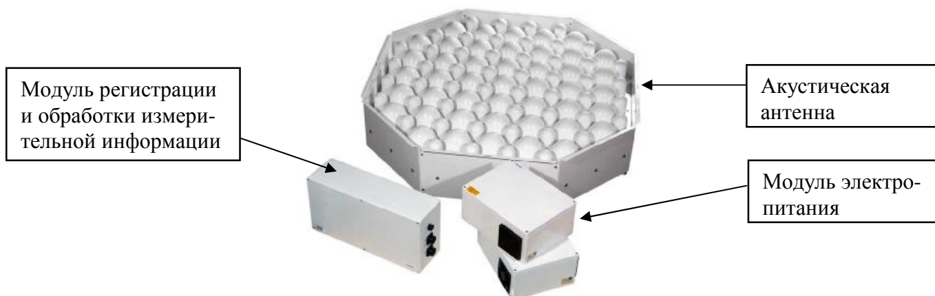
Рисунок 1а - Общий вид содаров FAS