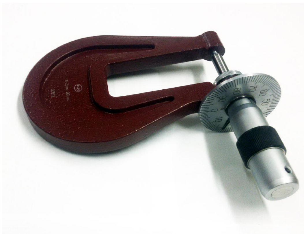
Рисунок 4 - Общий вид микрометров МЛ