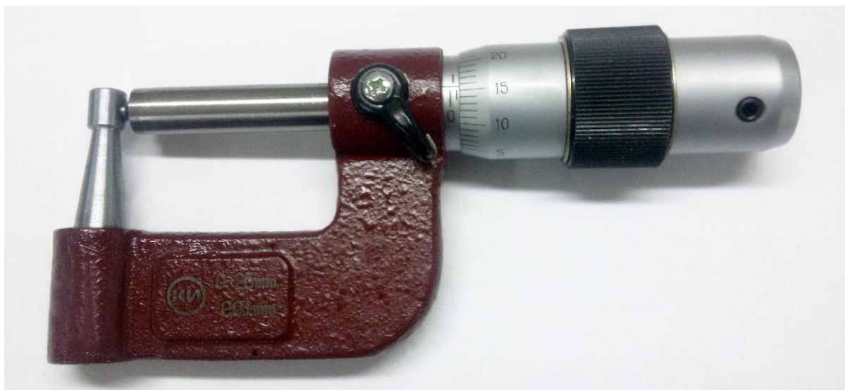
Рисунок 3 - Общий вид микрометров МТ