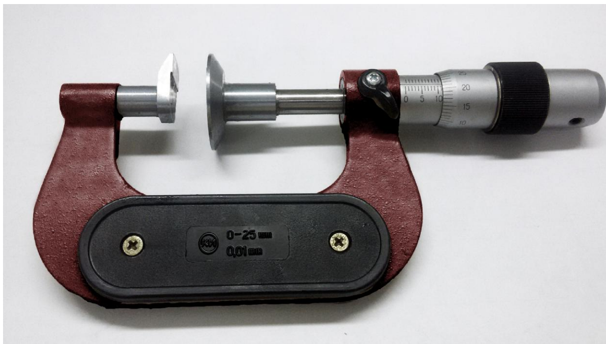
Рисунок 5 - Общий вид микрометров МЗ

Микрометры выпускаются под торговой маркой «АО КЗ «Красный инструментальщик»».