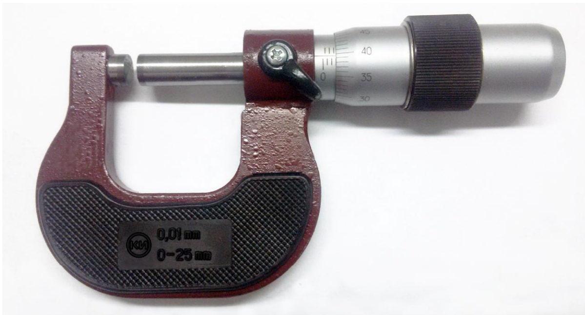
Рисунок 1 - Общий вид микрометра МК