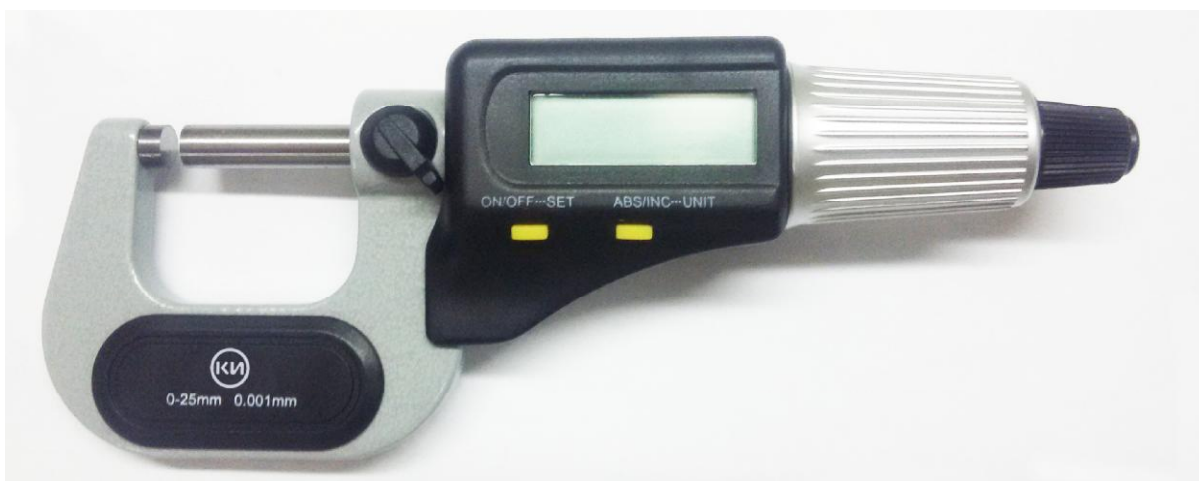
Рисунок 2 - Общий вид микрометра МК Ц