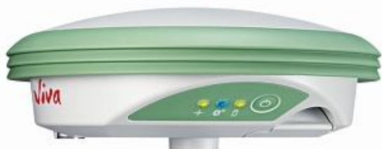
GS 08 RUS

На передней панели аппаратуры геодезической спутниковой Zenith 25 RUS расположены кнопка питания и функциональная клавиша, а также светодиодные индикаторы. В нижней части панели аппаратуры геодезической спутниковой Zenith 25 RUS расположен отсек для съемного аккумулятора и разъемы для карт памяти, а также порты питания, LEMO и USB.