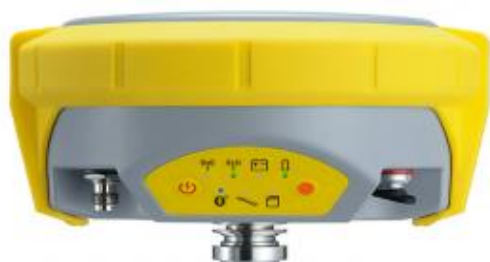
Zenith 25 RUS

Type: GS14 Unlimited RUS S.No.: ..... Equip.No.: ..... Art.No.: ..... Power: 12V / 700mA max. АО «ЭОМЗ» Шеллапутинский пер. 6, стр.3 Изготовлено: 2015 Сделано в России