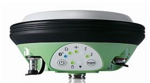
GS 14 RUS, GS 14 Unlimited RUS

Type: GS10 Unlimited RUS S.No.: ..... Art.No.: ..... Equip.No.: ..... Power 12V-24V / 2.5A max. CE 25 АО «ЭОМЗ» Шеллапутинский пер. 6, стр.3 Изготовлено: 2015 Сделано в России