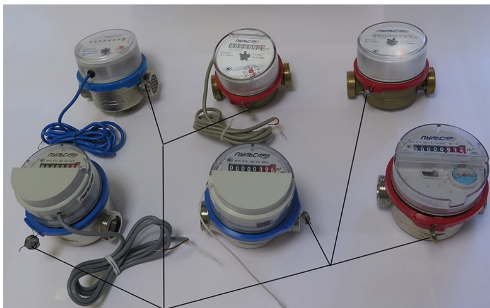
Место пломбирования и нанесения знака поверки

Знак поверки наносится на пломбу и на руководство по эксплуатации для исполнений счетчиков, приведенных на рисунке 2.