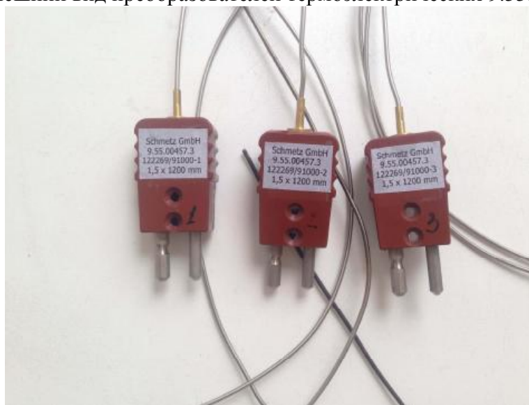
Рисунок 2 – Заводские номера и маркировка преобразователей термоэлектрических 9.55.00457.3