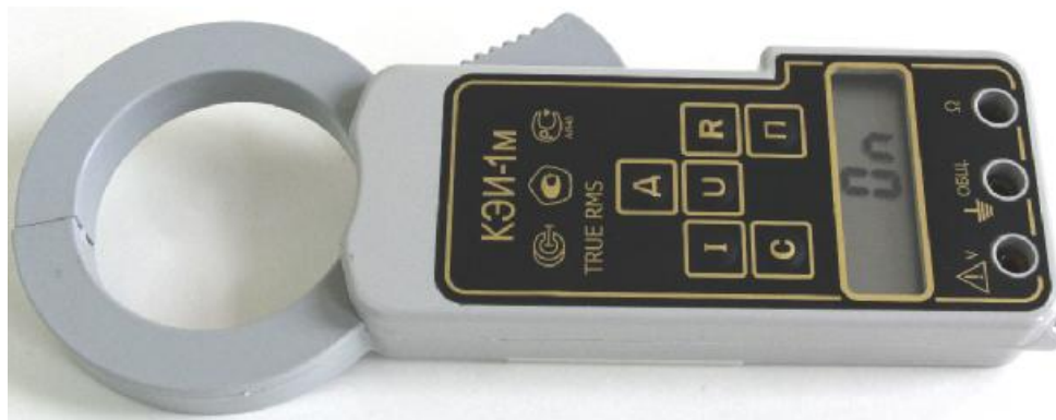
Рисунок 2 - Внешний вид клещей электроизмерительных КЭИ-1,0М. Вид сверху