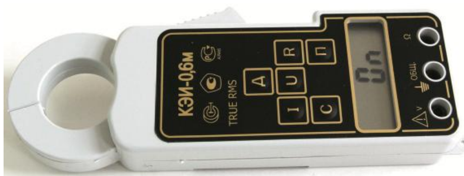
Рисунок 1 - Внешний вид клещей электроизмерительных КЭИ-0,6М. Вид сверху

Конструктивно клещи электроизмерительные выполнены в корпусе из ударопрочного пластика в форме клещей с увеличенной ручкой, внутри которой размещены печатная плата с электронной схемой обработки сигнала и батарея питания, на лицевой панели - цифровой 3,5 разрядный жидкокристаллический дисплей и органы управления. Клещи электроизмерительные выпускаются на два диапазона рабочих температур - А и В.