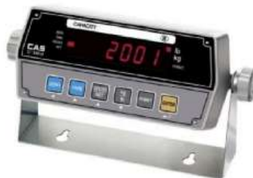
Рисунок 2 - Общий вид индикатора весов

Общий вид индикаторов представлен на рисунке 2.