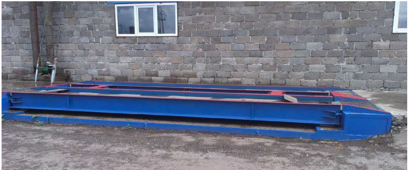
Рисунок 1 - Общий вид ГПУ весов (одна секция)

В зависимости от вариантов установки ГПУ устанавливается на металлическую раму или закладные плиты, которые располагаются на дорожном покрытии, бетонном фундаменте или в бетонном приямке. Длина ГПУ весов не более 24 м, ширина - не более 3 м. Масса весов не более 15 т.