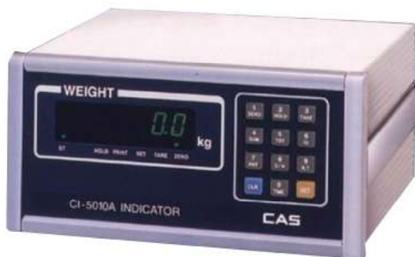
Рисунок 2 - Общий вид весоизмерительных приборов

Весы снабжены следующими настраиваемыми устройствами и функциями (в скобках указаны соответствующие пункты ГОСТ OIML R 76-1-2011