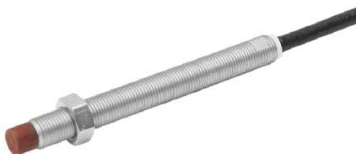
Рисунок 6 - Внешний вид датчика вихретокового типа ES400.010