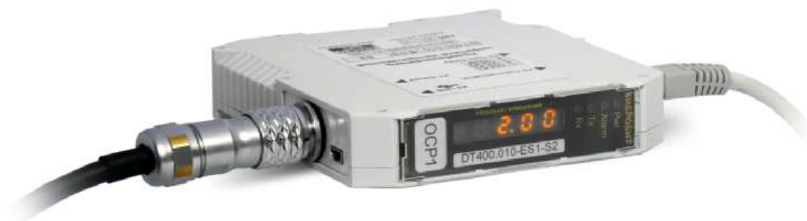
Рисунок 7 - Внешний вид измерительного преобразователя DT400.010