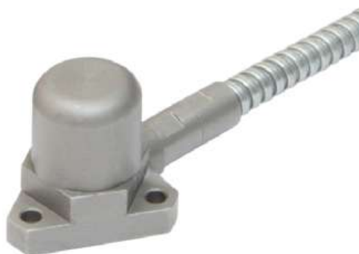
Рисунок 5 - Внешний вид датчика пьезоэлектрического типа IPS400.317