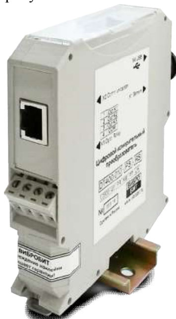
Рисунок 8 - Защитная пломба на корпусе измерительного преобразователя

На корпусе измерительного преобразователя DT400.010 расположена защитная пломба, предохраняющая его от несанкционированного вскрытия. Защитная пломба представляет собой наклейку с предупреждающей информацией: «Повреждение наклейки лишает гарантии». Наклейка устанавливается в нижней части корпуса измерительного преобразователя, скрепляя две его половины, как показано на рисунке 8.