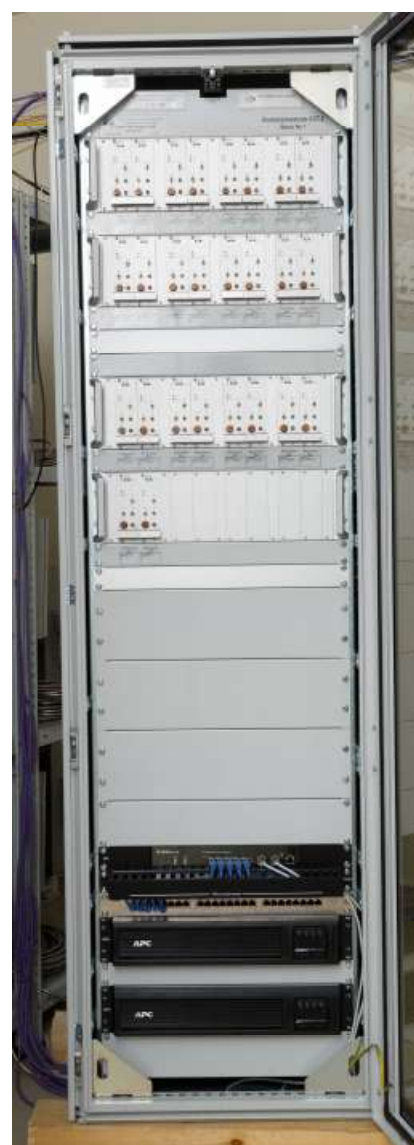
Рисунок 3 - Внешний вид стойки питания