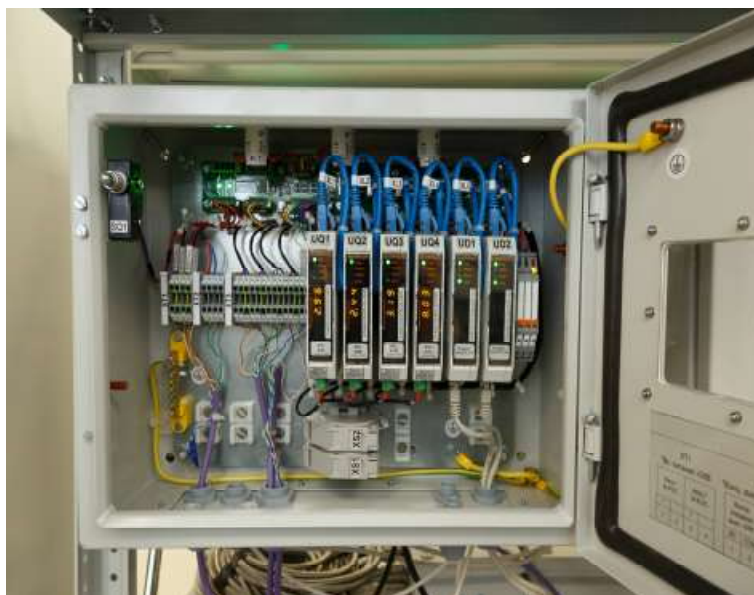
Рисунок 4 - Внешний вид шкафа комплекса виброконтрольного