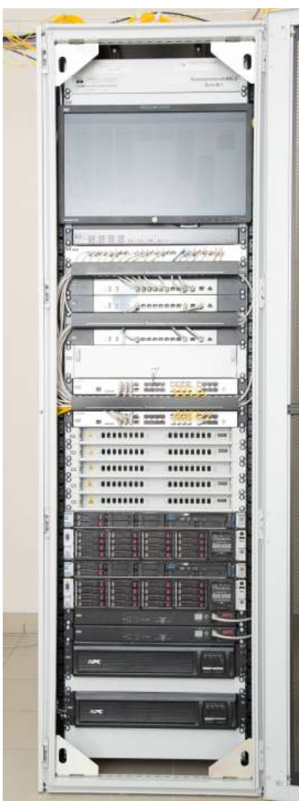
Рисунок 2 - Внешний вид стойки агрегатной