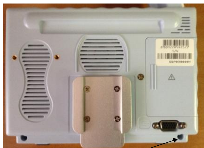
Место печатывания Рисунок 2 - Схема печатывания монитора VM1