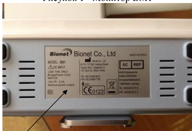
Место для нанесения знака утверждения типа Рисунок 3 - Схема маркировки монитора VM1