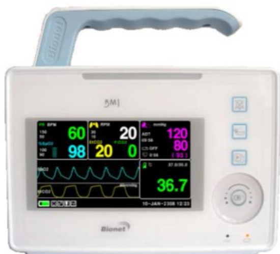
Рисунок 1 - Монитор VM1

Общий вид и схема маркировки мониторов пациента VM1, VM3 с принадлежностями представлены на рисунках 1-10.