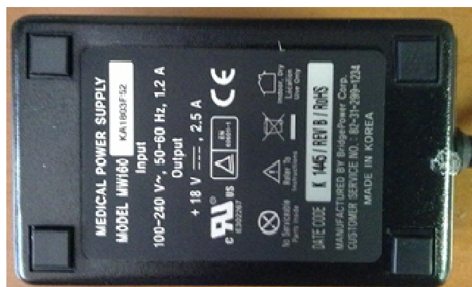
Рисунок 8 - Маркировка адаптера