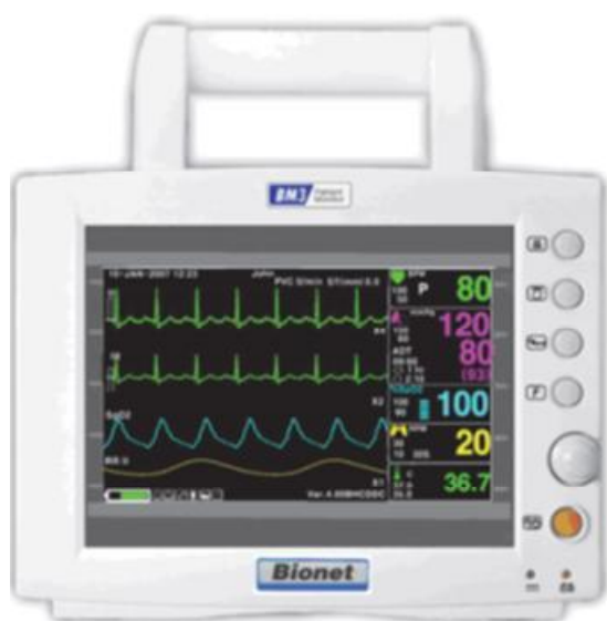
Рисунок 5 - Монитор VM3