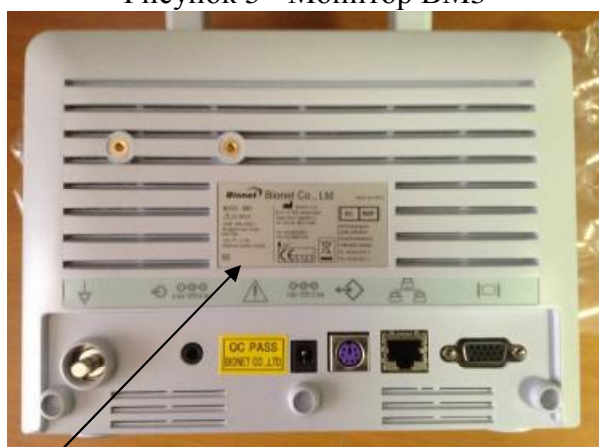
Место для нанесения знака утверждения типа