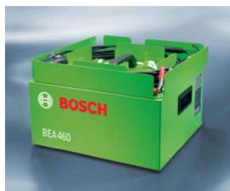
Рисунок 3 - Газоанализатор BEA 460