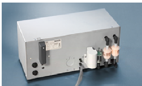
Рисунок 4 - Газоанализатор BEA 055