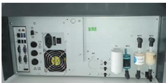
Рисунок 6 - Газоанализатор BEA 065