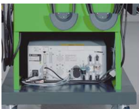
Рисунок 2 - Газоанализатор BEA 050