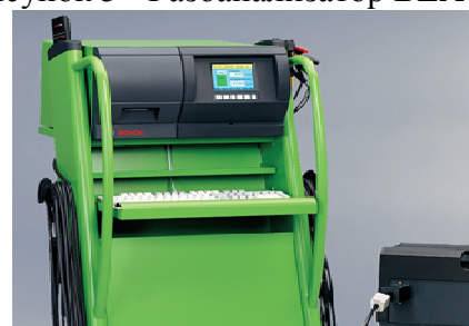
Рисунок 7 - Газоанализатор BEA 250, BEA 350