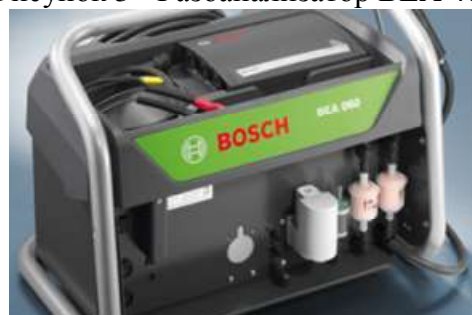
Рисунок 5 - Газоанализатор BEA 060