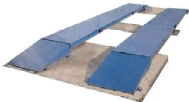
Рисунок 1 - Внешний вид применяемых индикаторов