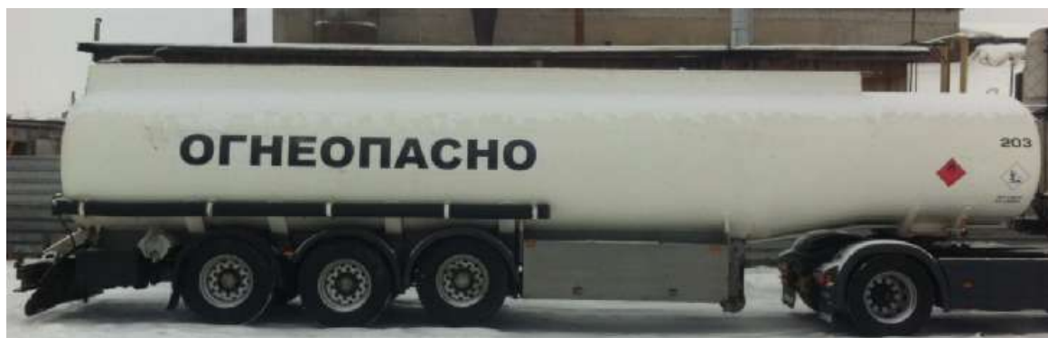
Фото 1 - Общий вид полуприцепа-цистерны INDOX

На боковых сторонах и сзади ППЦ имеет надпись «ОГНЕОПАСНО», знак ограничения скорости и знаки с информационными табличками для обозначения транспортного средства, перевозящего опасный груз.