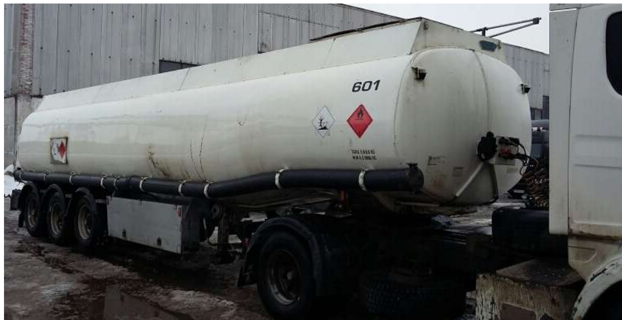
Фото 1 - Общий вид полуприцепа-цистерны INDOX

На боковых сторонах и сзади ППЦ нанесены знаки с информационными табличками для обозначения транспортного средства, перевозящего опасный груз.