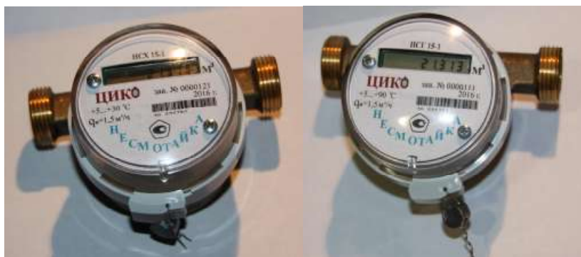
Рисунок 1 - Общий вид счетчиков холодной и горячей воды НС

В НСГ установлен полупроводниковый интегральный термометр с индивидуальной калибровкой, дающий возможность измерять объем воды с температурой выше пороговой температуры.