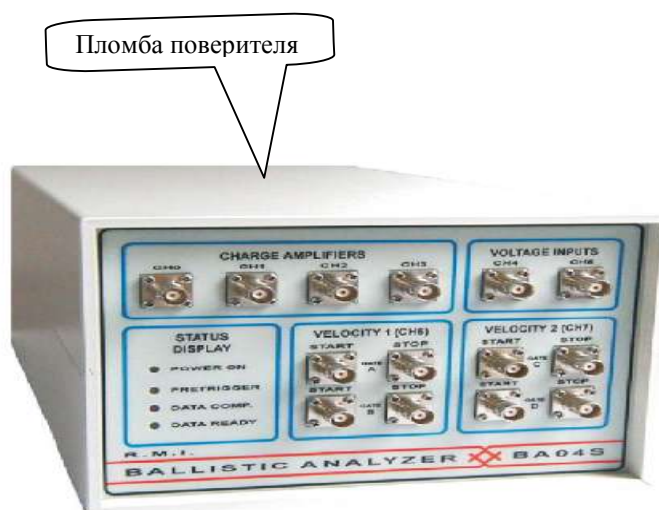
Рисунок 3 - BA04S - баллистический анализатор