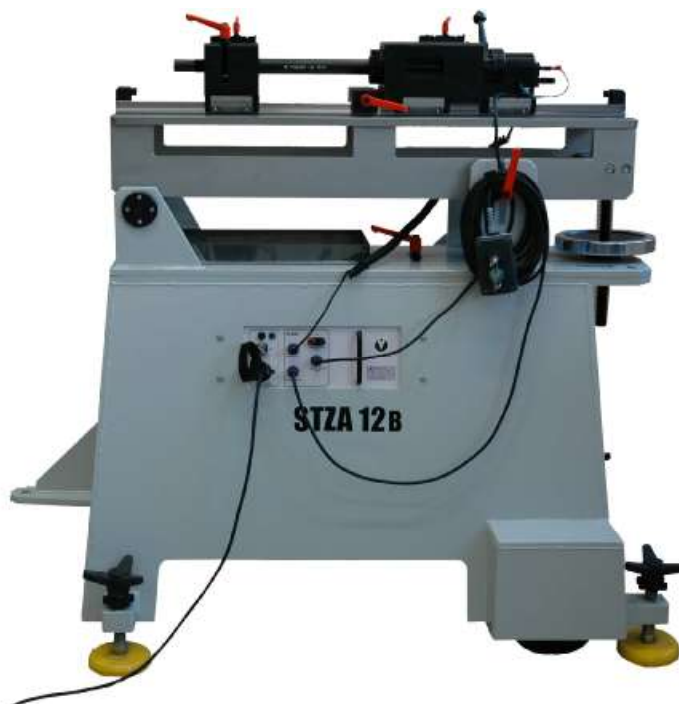
Рисунок 1 - Мобильный стрелковый стенд STZA 12B

Общий вид оборудования, входящего в состав системы приведен на рисунках 1- 7.