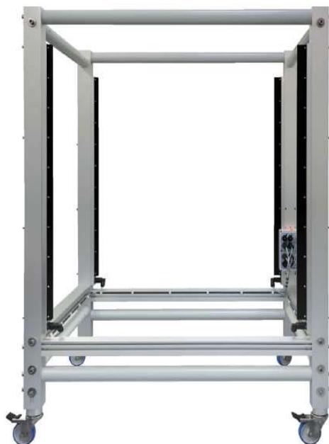
Рисунок 4 - WLS03 - стандартная передвижная атмосферостойкая оптическая рамка