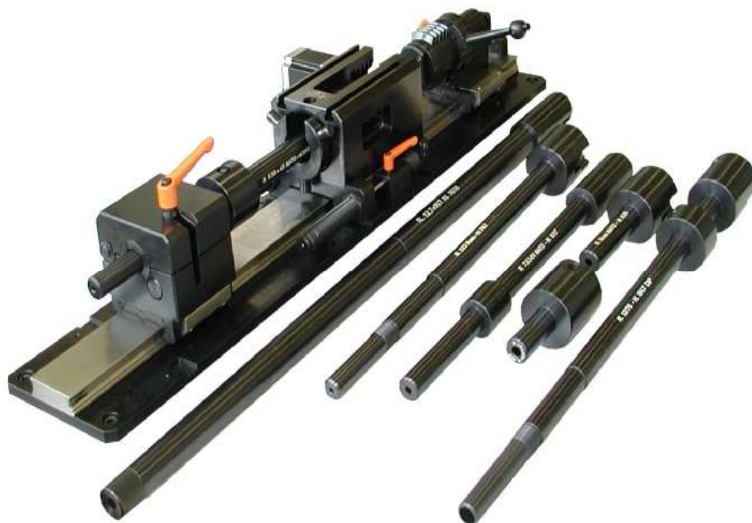
Рисунок 2 - Баллистический затвор UZ-2002 и измерительные баллистические стволы