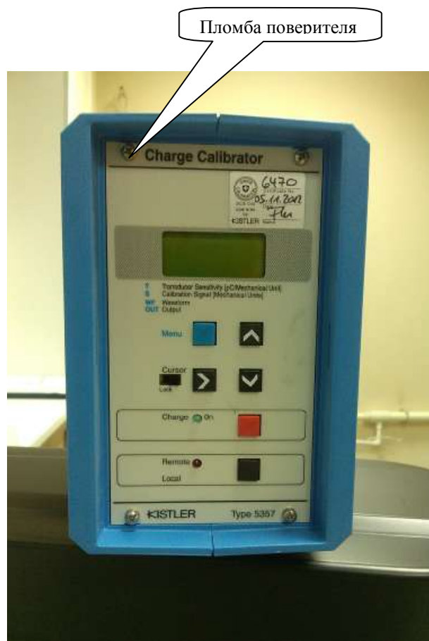
Рисунок 6 - Kistlr 5357B10 - калибратор заряда для баллистического анализатора ВА04S