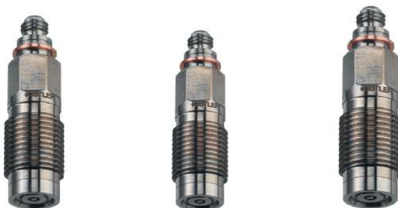
Рисунок 5 - Кварцевые датчики высокого давления «Kistler 6215, Kistler 607C2 , Kistler 6213 BK»