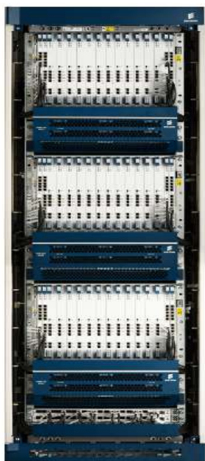
Рисунок 1 - Общий вид оборудования

Общий вид оборудования и схема блокировки от несанкционированного доступа, представлены на рисунках 1 и 2.