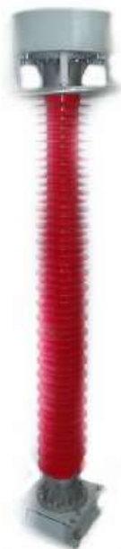
Рисунок 4 - Высоковольтный емкостной делитель ДНЕЭ-220