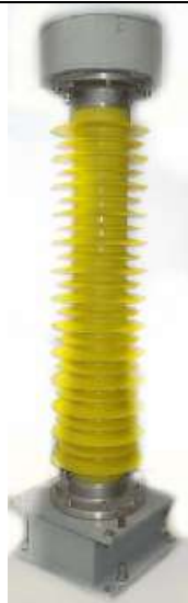
Рисунок 2 - Высоковольтный емкостной делитель ДНЕЭ-110

Внешний вид ДНЕЭ в зависимости от исполнения приведен на рисунках 2-10.