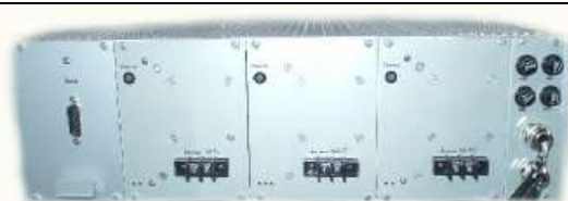
Рисунок 8 - Электронный блок ЦАП Н для вывода пропорционального аналогового сигнала 100/\sqrt{3} В ДНЕЭ вид сзади