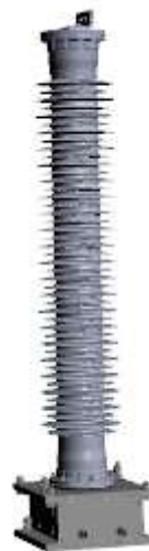
Рисунок 5 - Высоковольтный емкостной делитель с встроенным в изолятор компенсатором температурного расширения ДНЕЭ-123-М