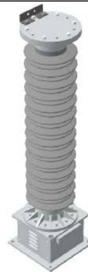
Рисунок 3 - Высоковольтный емкостной делитель с встроенным в изолятор компенсатором температурного расширения ДНЕЭ-110ВК