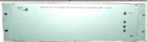
Рисунок 7 - Электронный блок ЦАП Н для вывода пропорционального аналогового сигнала 100/\sqrt{3} В ДНЕЭ