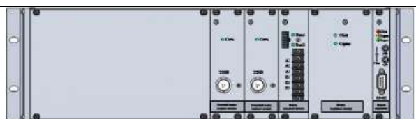
Рисунок 10 - Электронный блок резервированного блока питания повышенной надежности (вид сзади)