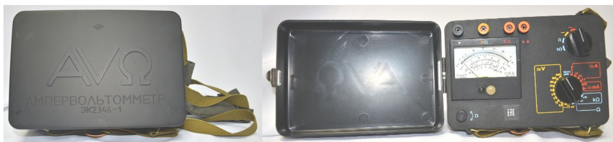
Рисунок 1 - Внешний вид приборов