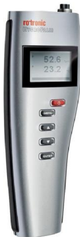
Рисунок 1 - Внешний вид гигрометра Rotronic модификации HygroPalm

Внешний вид гигрометра Rotronic модификации HygroPalm приведен на рисунке 1. Место пломбировки корпуса измерительного преобразователя от несанкционированного доступа и место нанесения знака поверки показаны на рисунке 2 (знак поверки наносится в том случае, если условия эксплуатации обеспечивают сохранность знака в течение всего интервала между поверками).