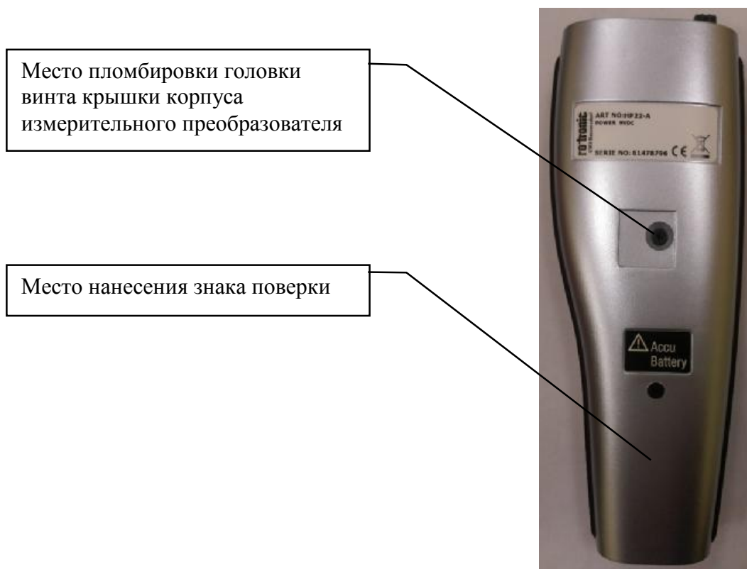
Рисунок 2 - Место нанесения знака поверки и пломбирования от несанкционированного доступа гигрометра Rotronic модификации HygroPalm

Гигрометр Rotronic модификации HygroLog NT представляет собой портативный измерительный прибор с графическим жидкокристаллическим дисплеем и клавишами управления. В дополнение к встроенным функциям вышеописанной модификации HygroPalm, гигрометр осуществляет одновременную запись результатов измерений в собственную энергонезависимую память. Гигрометр включает в себя: