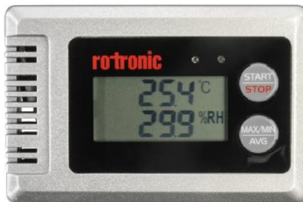
Рисунок 8 - Внешний вид гигрометра Rotronic модификации HL-1D

поверки наносится в том случае, если условия эксплуатации обеспечивают сохранность знака в течение всего интервала между поверками).