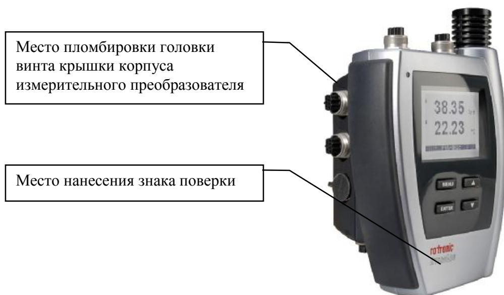
Рисунок 4 - Место нанесения знака поверки и пломбирования от несанкционированного доступа гигрометра Rotronic модификации HygroLog NT