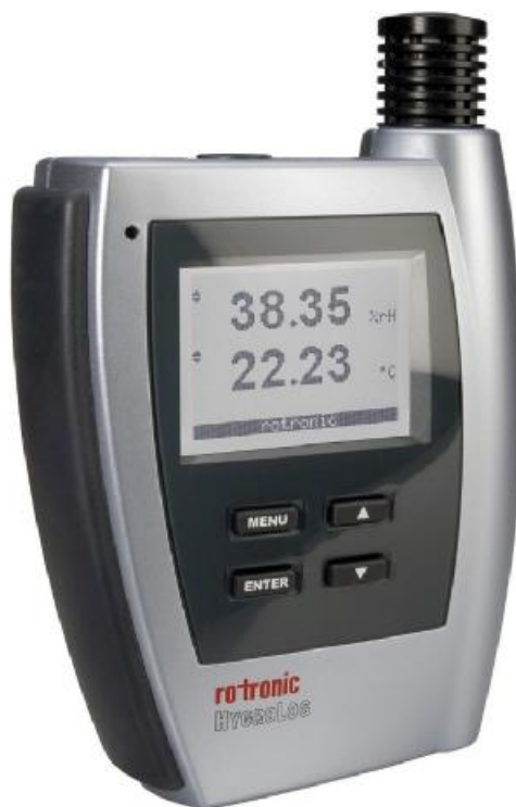
Рисунок 3 - Внешний вид гигрометра Rotronic модификации HygroLog NT

Внешний вид гигрометра Rotronic модификации HygroLog NT приведен на рисунке 3. Место пломбировки корпуса измерительного преобразователя от несанкционированного доступа и место нанесения знака поверки показаны на рисунке 4 (знак поверки наносится в том случае, если условия эксплуатации обеспечивают сохранность знака в течение всего интервала между поверками).