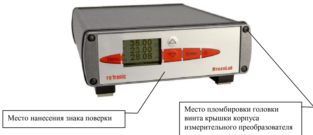
Рисунок 5 - Внешний вид, место нанесения знака поверки и пломбирования от несанкционированного доступа гигрометра Rotronic модификации HygroLab C1

Внешний вид гигрометра Rotronic модификации HygroLab C1, место пломбировки корпуса измерительного преобразователя от несанкционированного доступа и место нанесения знака поверки показаны на рисунке 5 (знак поверки наносится в том случае, если условия эксплуатации обеспечивают сохранность знака в течение всего интервала между поверками).