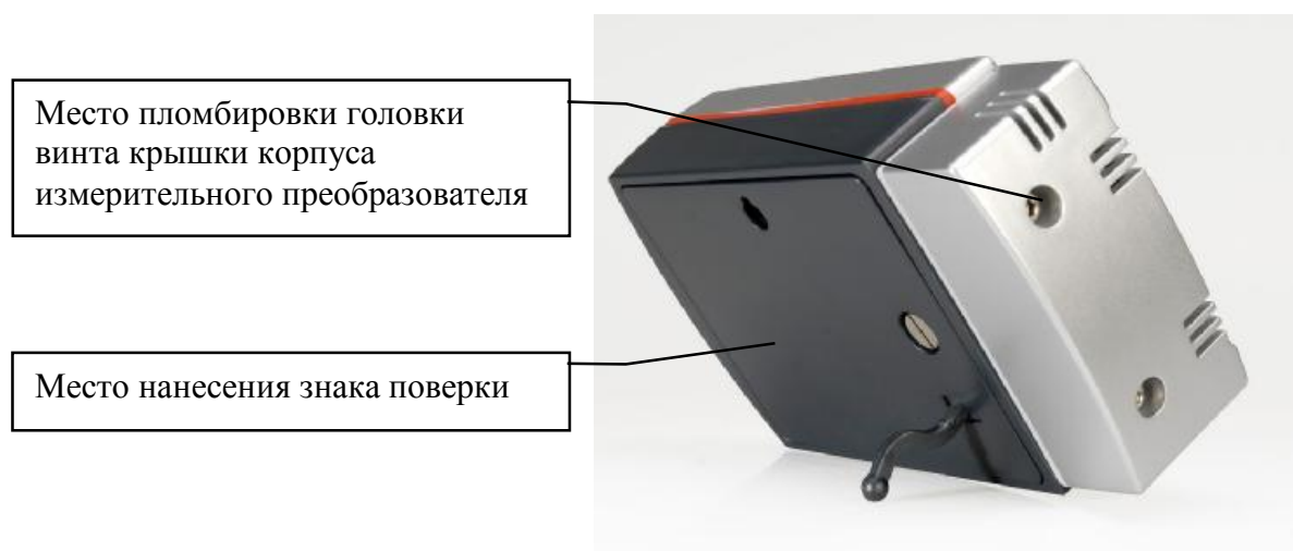
Рисунок 7- Место нанесения знака поверки и пломбирования от несанкционированного доступа гигрометра Rotronic модификации HL-20D

Гигрометр Rotronic модификации HL-1D представляет собой портативный измерительный прибор с графическим жидкокристаллическим дисплеем и клавишами управления. Гигрометр осуществляет запись результатов измерений в собственную энергонезависимую память. Гигрометр выполнен в едином корпусе измерительного преобразователя со встроенным зондом влажности и температуры. Внешний вид гигрометра Rotronic модификации HL-1D приведен на рисунке 8. Место пломбировки корпуса измерительного преобразователя от несанкционированного доступа и место нанесения знака поверки показаны на рисунке 9 (знак