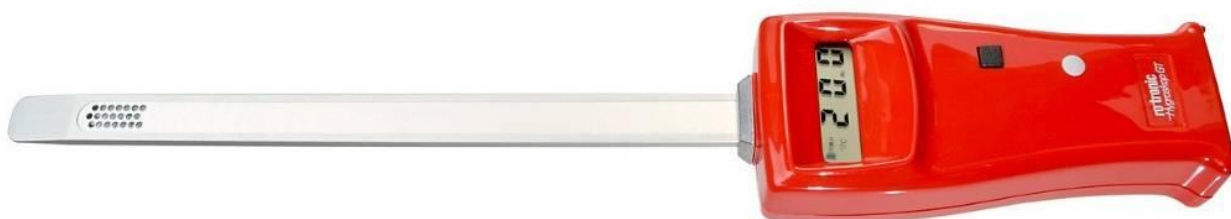
Рисунок 10 - Внешний вид, место нанесения знака поверки и пломбирования от несанкционированного доступа гигрометра Rotronic модификации GTS

Гигрометр Rotronic модификации GTS представляет собой ручной прибор, включающий в себя преобразовательный блок с жидкокристаллическим дисплеем и плоский измерительный штык-зонд, жёстко закреплённый на корпусе преобразовательного блока.