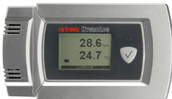
Рисунок 6 - Внешний вид гигрометра Rotronic модификации HL-20D

Внешний вид гигрометра Rotronic модификации HL-20D приведен на рисунке 6. Место пломбировки корпуса измерительного преобразователя от несанкционированного доступа и место нанесения знака поверки показаны на рисунке 7 (знак поверки наносится в том случае, если условия эксплуатации обеспечивают сохранность знака в течение всего интервала между поверками).