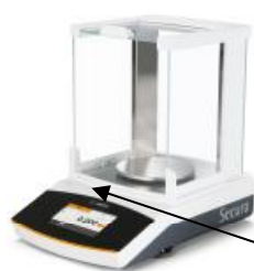
Рисунок 2в - Весы: SQP-B SECURA 613-1ORU.

Фотографии внешнего вида весов представлены на рисунках 2а - 2л.