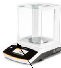
Рисунок 2ж - Весы: SQP-B QUINTIX 613-1ORU