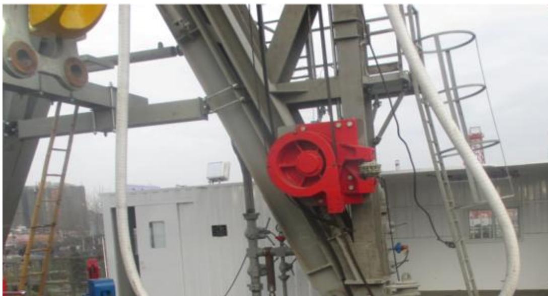
Рисунок 2 - Общий вид фиксатора неподвижного каната полиспаста