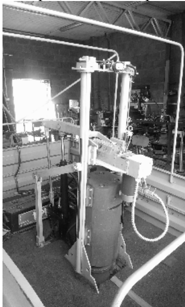
Рисунок 1 - Внешний вид измерителей прочности дорожных ДИП Импульс

Для предотвращения несанкционированного доступа к внутренним частям измерителей производится пломбировка корпуса штампа с встроенными измерительными датчиками.