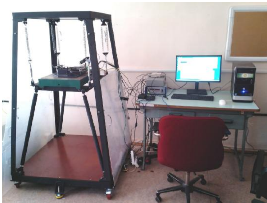
Рисунок 1 – Общий вид СпМК