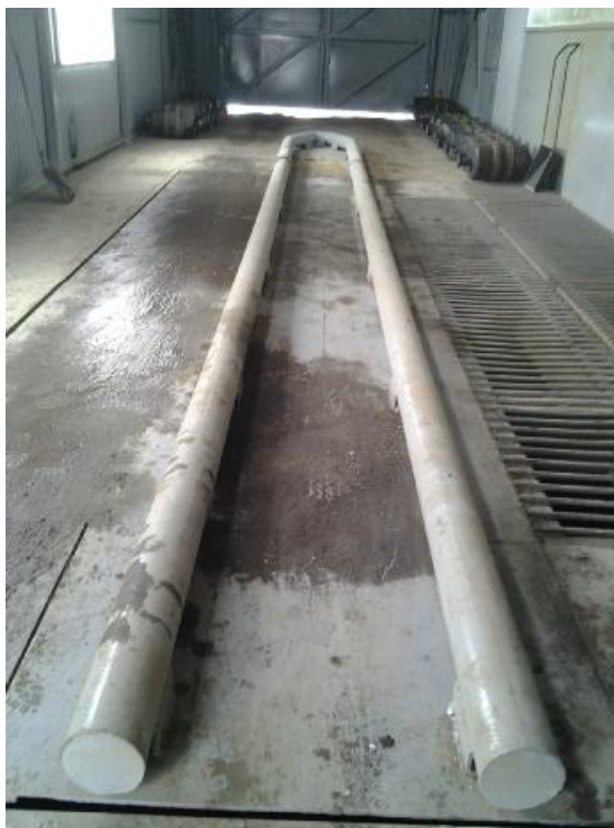
Рисунок 1 – Общий вид весов КОНТЕК

Общий вид весов автомобильных неавтоматического действия КОНТЕК представлен на рисунке 1.