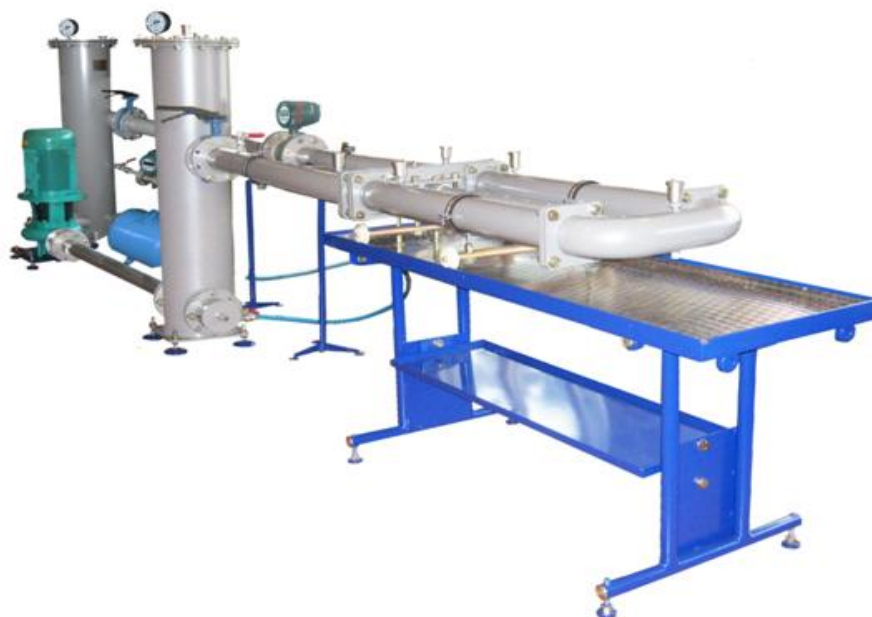
Рисунок 1 - Общий вид установок поверочных малогабаритных МПУ «СЭМ»-2-200

Место пломбирования установок расположено на обратной стороне корпуса тепловычислителя «Тепло-3ВЭ» и показано на рисунке 2.