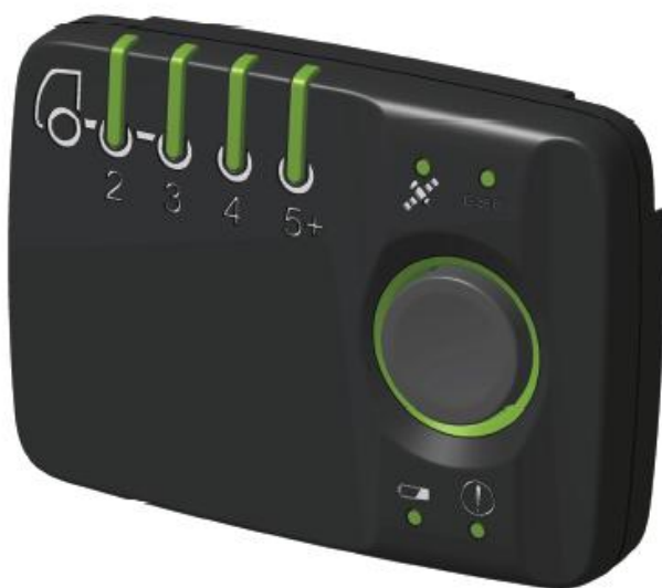
Рисунок 1 - Общий вид устройства (исполнение корпуса 01)

Внешний вид устройства с указанием мест нанесения знака утверждения типа и пломбирования приведен на рисунках 1-4.