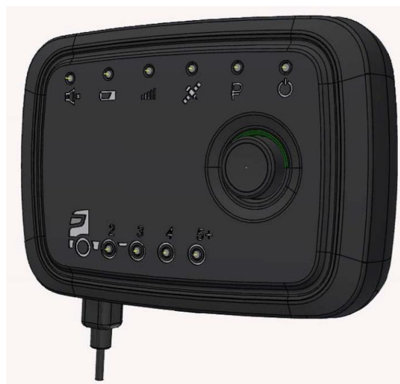
Рисунок 2 - Общий вид устройства (исполнения корпуса 02)